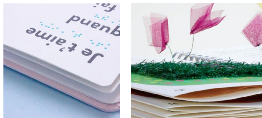
Solène Négrerie Editions Les Doigts Qui Rêvent