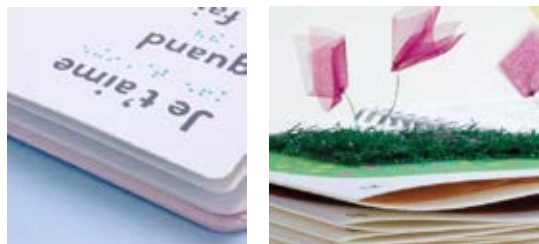
Solène Négrerie Editions Les Doigts Qui Rêvent